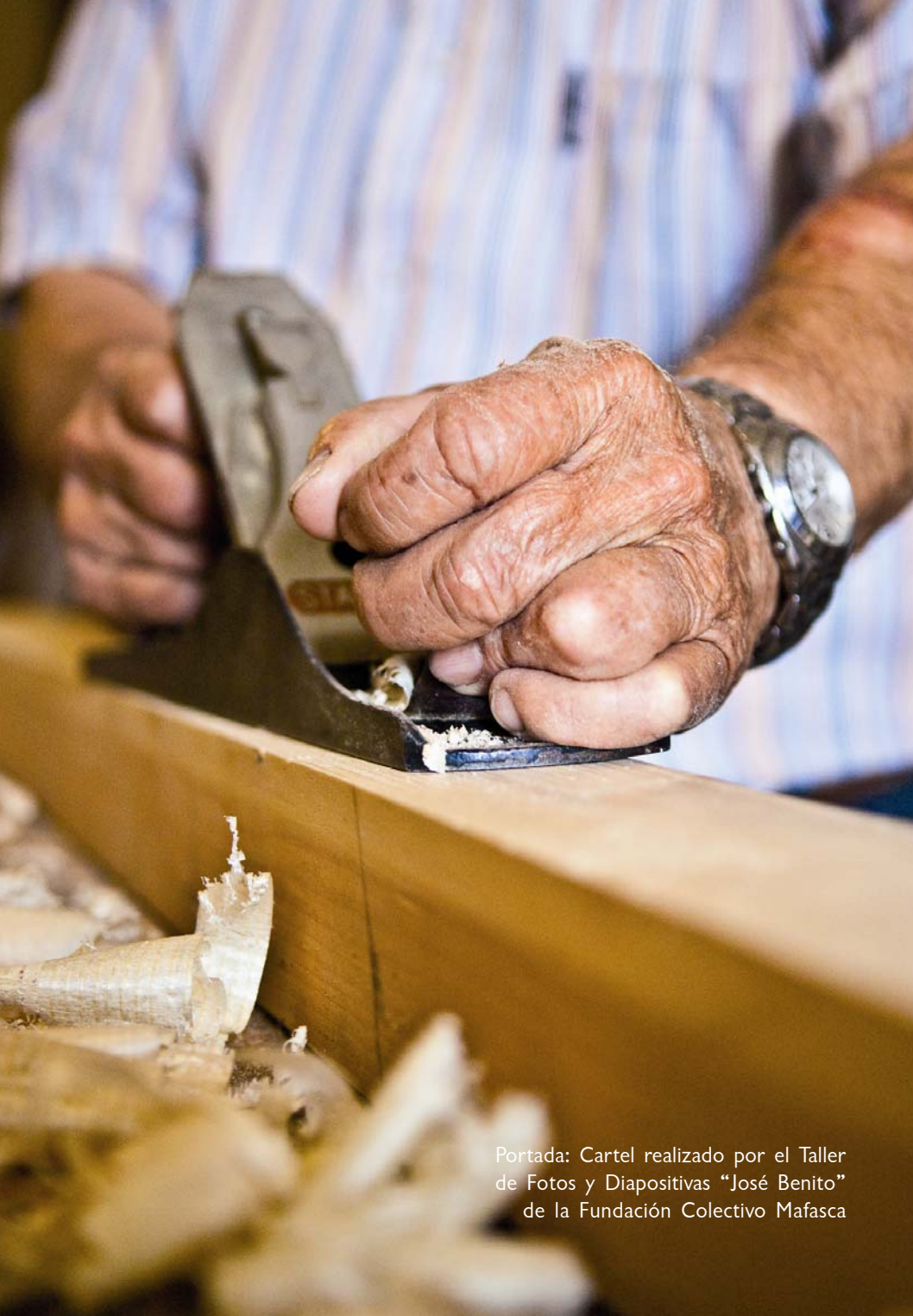
Portada: Cartel realizado por el Taller de Fotos y Diapositivas "José Benito" de la Fundación Colectivo Mafasca